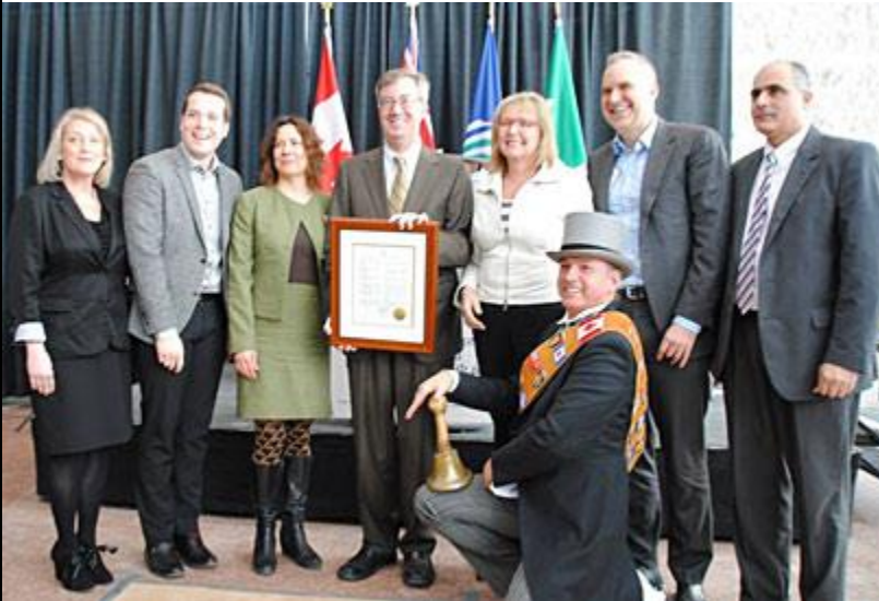
Heritage Day 2015 | La Fête du patrimoine 2015