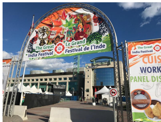
Le kiosque du Punjab dans la tente d'expositions culturelles et l'entrée du Grand festival de l'Inde

En juillet et août, l'Alliance culturelle d'Ottawa, en partenariat avec la Ville d'Ottawa, Ottawa Tourisme et BIA du Marché By, s'efforce de faire connaître au public toutes nos offres culturelles - grâce à un projet pilote : un kiosque de tourisme culturel. Il est situé sur le marché By au 'York Street Plaza', près du célèbre panneau de signalisation / photo OTTAWA. Nos étudiants ambassadeurs partagent des informations sur les événements culturels locaux avec le public et les engagent dans des activités sur place. Le Conseil des organismes du patrimoine et le Réseau des festivals d'Ottawa dirigent les efforts de l'Alliance dans le cadre de ce projet pilote passionnant que nous appelons «The OTTAWA Experience».