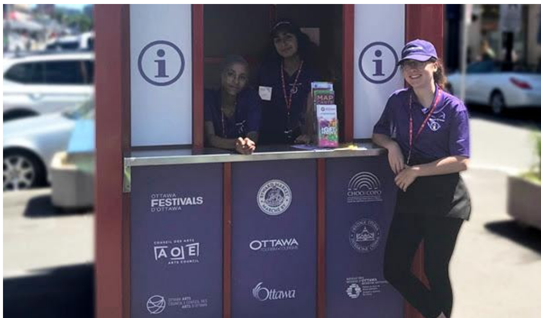
Some of the cultural tourism kiosk ambassadors

We hope everyone is enjoying Archaeology Month in Canada's Capital region. And, participating in some of our many wonderful cultural communities' events, such as The Great India Festival and Greekfest. We're so fortunate to live in a city that is such a rich tapestry of diverse, vibrant and evolving cultural heritage and offerings.