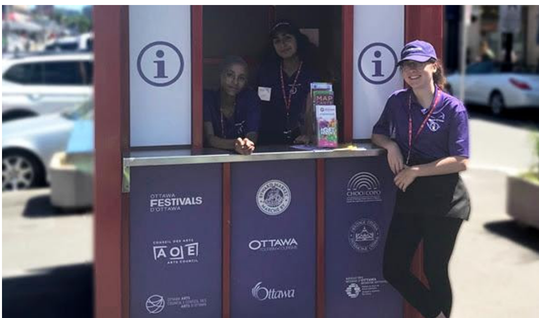
Le kiosque de tourisme culturel au Marché By

Nous espérons que tout le monde profite du Mois de l'archéologie dans la région de la capitale du Canada. Et que vous avez la chance de participer à certains de nos nombreux et merveilleux événements communautaires, tels que le Grand festival de l'Inde et Greekfest. Nous avons la chance de vivre dans une ville riche en patrimoine, et qui offre des activités culturelles diversifiées, dynamiques et en constantes évolution.