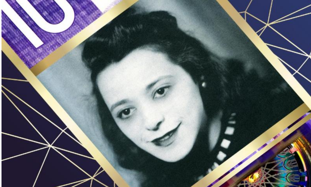
Le nouveau billet 10$ de Viola Desmond, bientôt dans nos portefeuilles.

La capitale du Canada a rendu notre pays fier avec la célébration du 100e anniversaire des cent jours du Canada et l'armistice marquant la fin de la Première Guerre mondiale. Nos compliments à tous ceux qui ont présenté des programmes et organisé des cérémonies exemplaires pour marquer cet événement important, et à tous ceux qui ont participé aux activités. À cause de ces gens si courageux, et leurs si grands sacrifices, nous pouvons apprécier notre bonne fortune aujourd'hui.